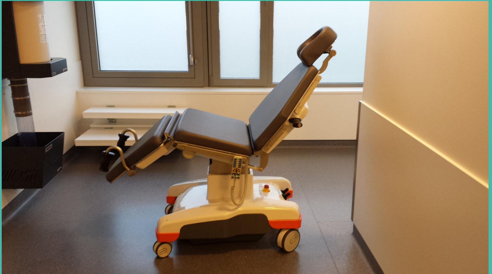
Tablette de gynécologie Bouge