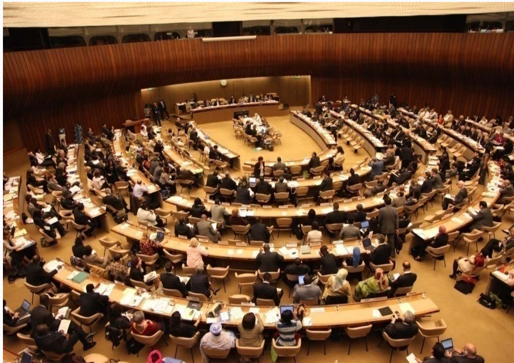
64th World Health Assembly, 2011 Resolutions WHA 64.7 : Strengthening Nursing