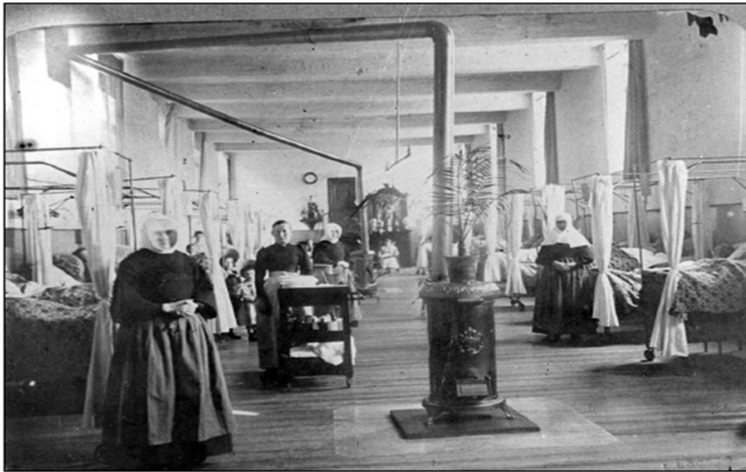
Vieux-Bavière, Salle de malades, ca 1895, Lg MVW n° A54514