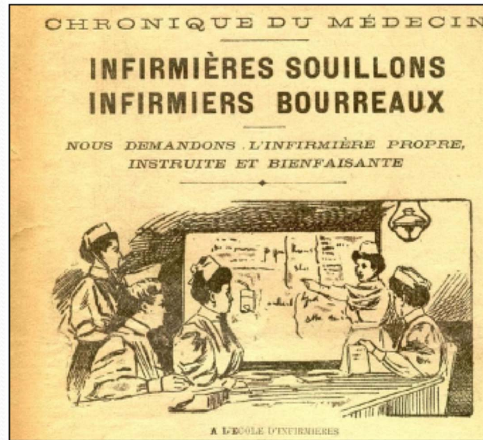
Le Petit Bleu, 1910 – ACPAS Lg