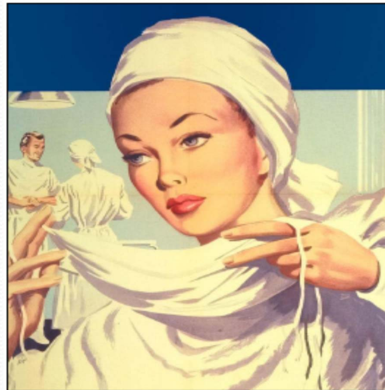
Musée Fl. Nightingale